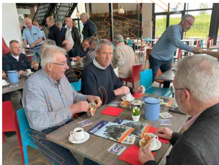
Regio Zeeland te Nieuworp