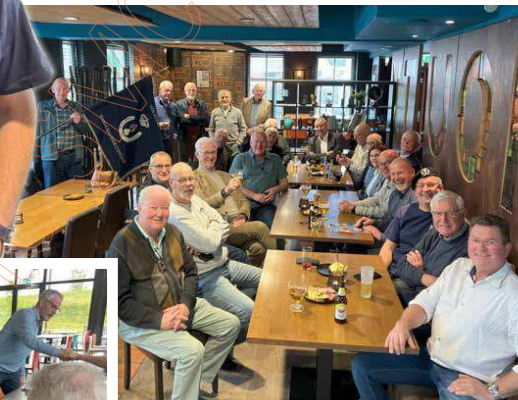
Regio Amersfoort/Utrecht te Hooglanderveen