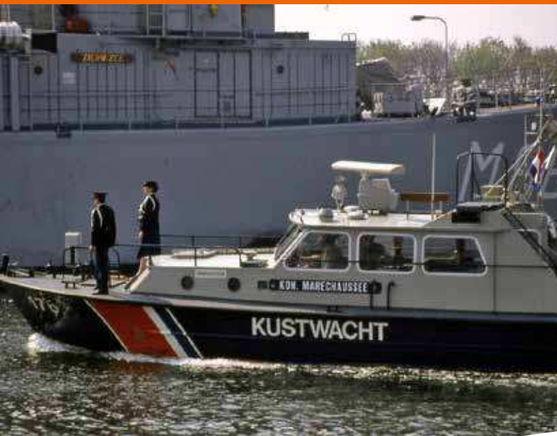
1989, Den Helder