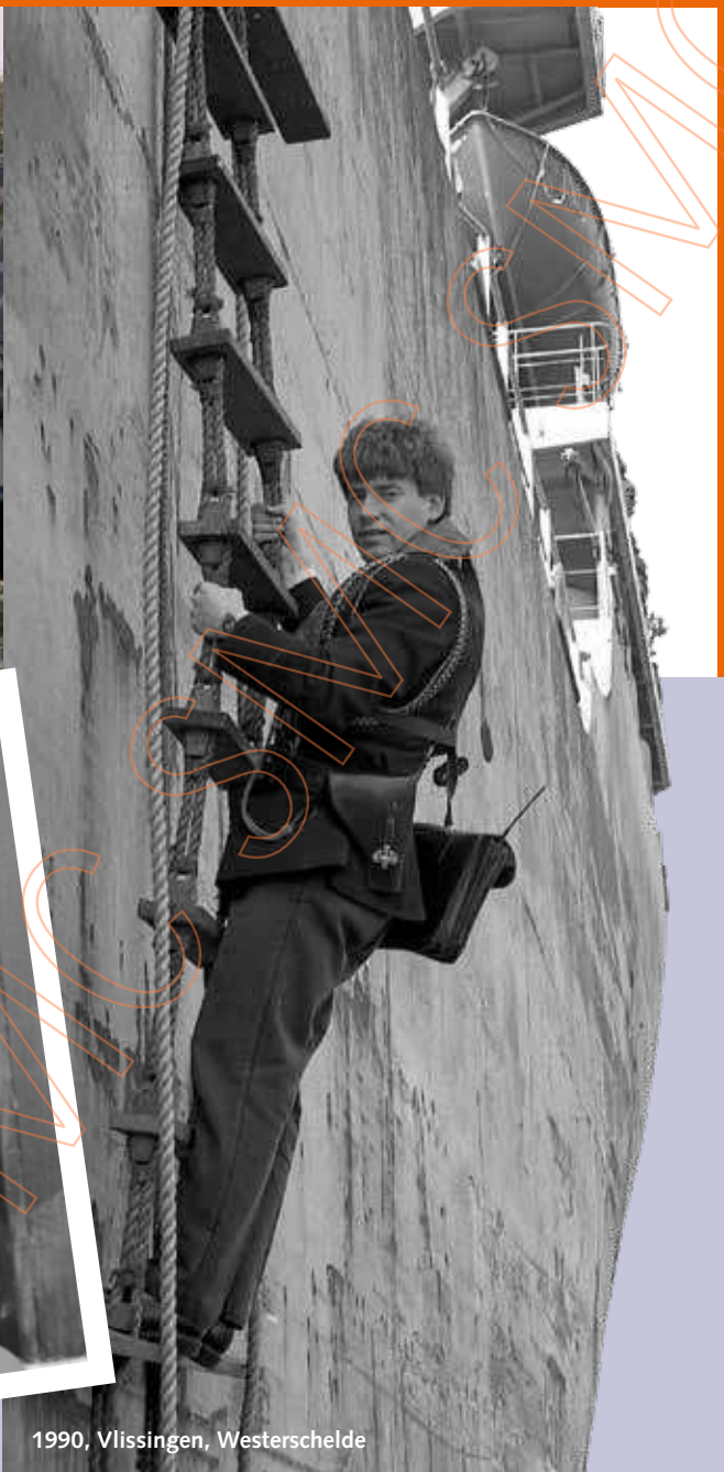
1990, Vlissingen, Westerschelde