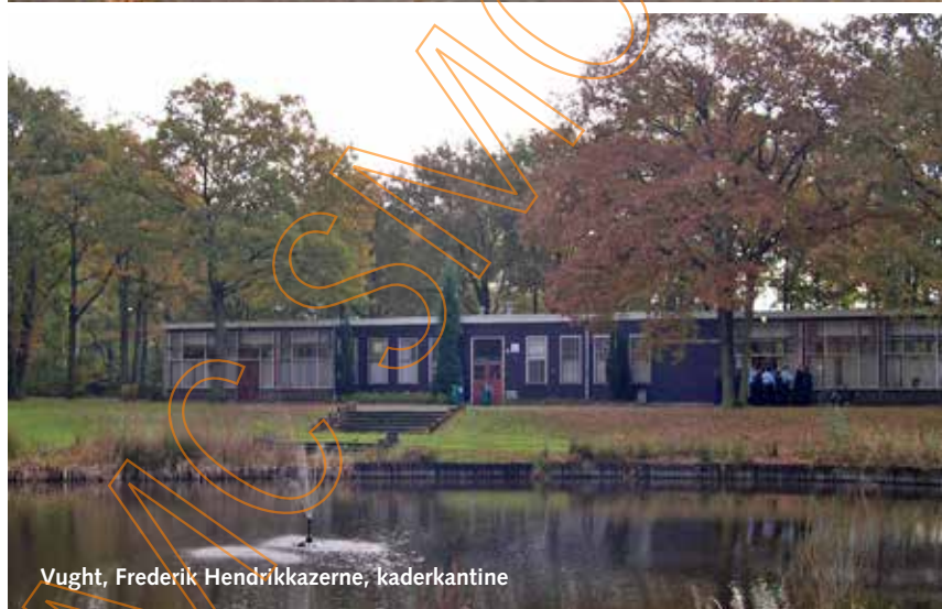
Vught, Frederik Hendrikkazerne, kaderkantine

ook de aandacht. Die dachten bouwgrond of een grotere tuin te kunnen krijgen, maar kregen een rumoerige kazerne."