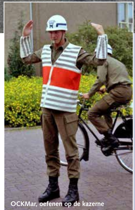
OCKMar, oefenen op de kazerne

langs je heen zoeven. Een stopteken geven, kruispunt vrijhouden en snelheid minderen. Dat waren toch de eerste momenten dat je in uniform als overheidsdienaar het gedrag van anderen moest sturen. En ging dat goed, dan op naar de Asselsestraat in Apeldoorn, echte bestuurders trotseren. Was toch wel een momentje, helemaal alleen daar midden op dat kruispunt. Wanneer dat goed ging, kwam het echte werk: in de praktijk met de VW Transporter of op de motor een colonne door een stad leiden, kruising vrijmaken en door. Altijd respect gehad voor de collega's op de motor. Voor de echte diehards op twee wielen hadden we