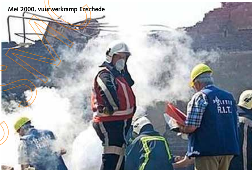
Mei 2000, vuurwerkramp Enschede

ongevallen waarbij moeilijk te identificeren slachtoffers te betreuen waren. Zelf ben ik betrokken geweest bij kleinschalige korte inzetten bij een brand in Groesbeek (2000), op Schiphol ten behoeve van gerepatrieerde slachtoffers van een misdrijf in Mali (2000), in Elst met AM-werkzaamheden rond een verongelukt Nederlands gezin in de Gleinalmtunnel in Oostenrijk (2001), in Nijmegen bij een brand (2002) en bij verkeersongevallen in Veghel (2003), Almelo (2004) en Goor (2005). Vrijwel al deze inzetten waren bijzonder tragisch omdat daarbij veel (zeer) jonge slachtoffers te betreuen waren. De compartimentering en vooral de kameraadschappelijke gesprekken maakten die tragedies voor de meesten van ons dragelijk(er).