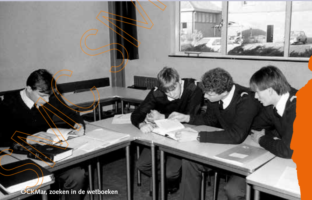
OCKMar, zoeken in de wetboeken