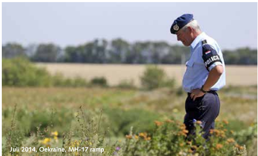
Juli 2014, Oekraïne, MH-17 ramp

Wederom een zeer indrukwekkende (en eervolle) taak waarmee ik mijn operationele marechaussee-leven heb mogen afsluiten. Je maakt wat mee bij de marechaussee!