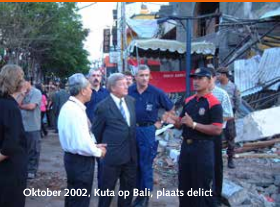
Oktober 2002, Kuta op Bali, plaats delict