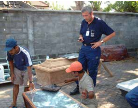
Oktober 2002, Kuta op Bali, transport gereedmaken van een Nederlands slachtoffer