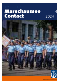
Foto omslag: Den Haag, 25 juli 2024, defilé Nederlandse Veteranendag