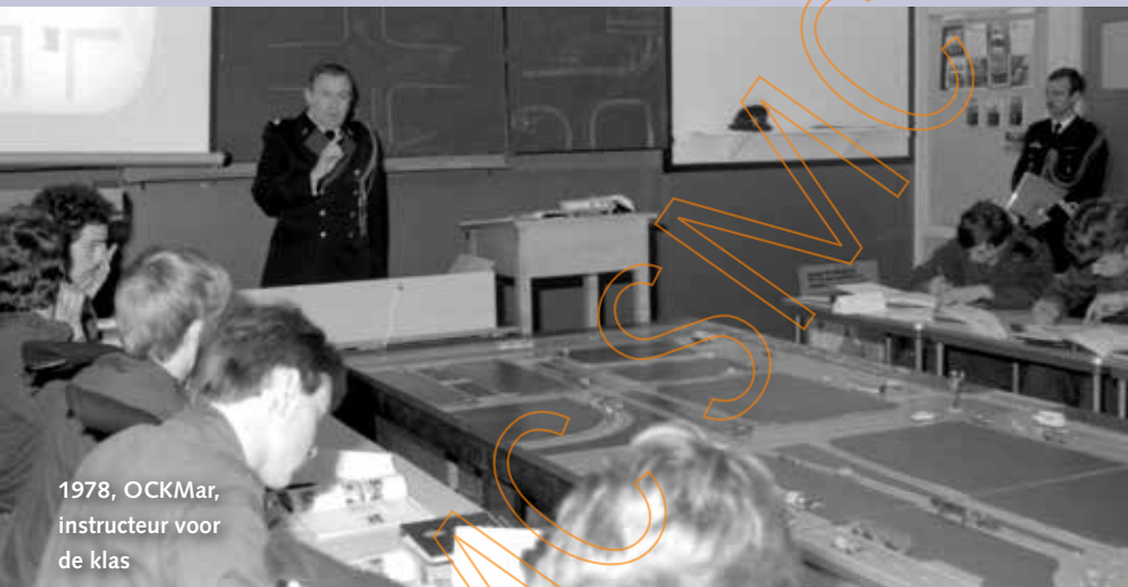
1978, OCKMar, instructeur voor de klas