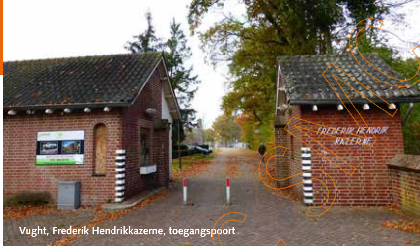
Vught, Frederik Hendrikkazerne, toegangspoort