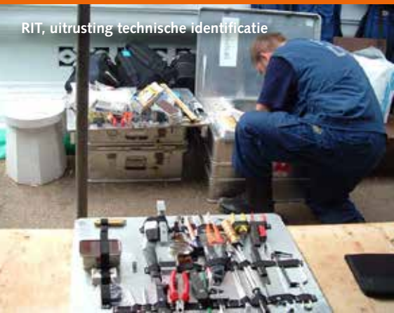
RIT, uitrusting technische identificatie