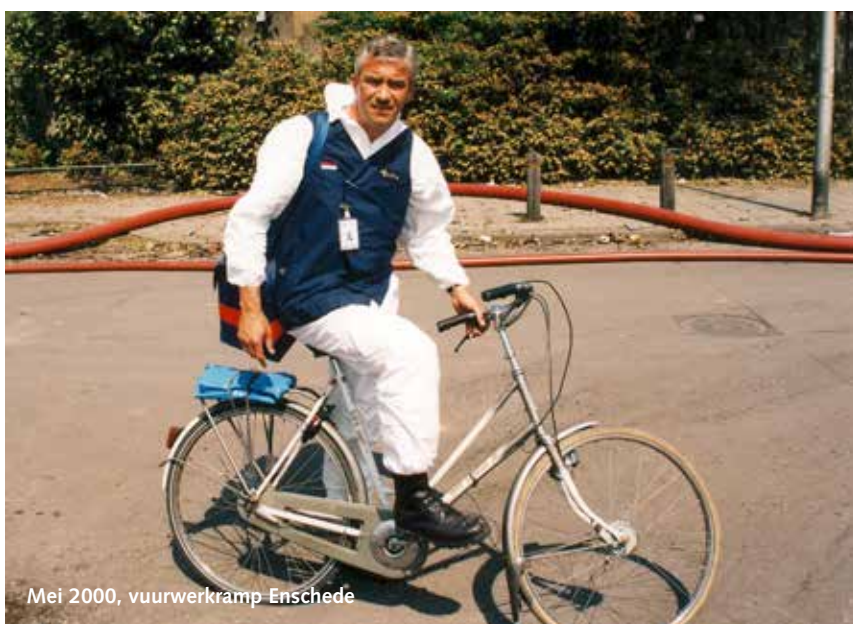
Mei 2000, vuurwerkramp Enschede